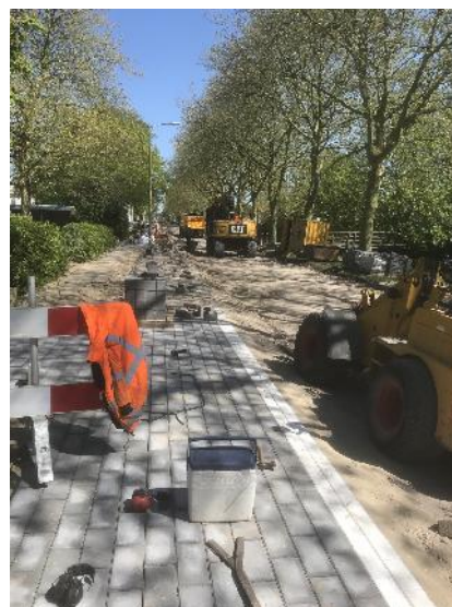
Werken aan de Gouderegensingel

Wat na de bovengenoemde straten nog overblijft is het gedeelte van de Meidoornlaan tussen de Goudenregensingel en de Oostlaan. Ook zullen hier en daar nog wat aanpassingen plaatsvinden (zoals de punaise hoek Prunuslaan / Noordweg en 30 km aanduiding bij Nootdorpseweg en Goudenregensingel). De werkzaamheden aan dit gedeelte hoopt de aannemer in week 22 te kunnen afronden. De werkzaamheden die dan nog moeten worden verricht zijn het afvoeren van de overtollige materialen en de bouwketen alsmede het weer in de oorspronkelijke staat opleveren van de door de aannemer gebruikte locaties.